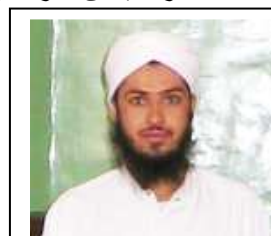
مولوی عبدالرحمان رجبی