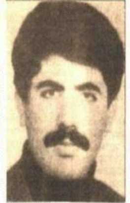
Baytap- Daha önce konuşmamıştı

Baytap'a ait 10 Ekim 1993 tarihinde düzenlenen ifade tespit tutanağında, 26 Aralık 1992 ta-